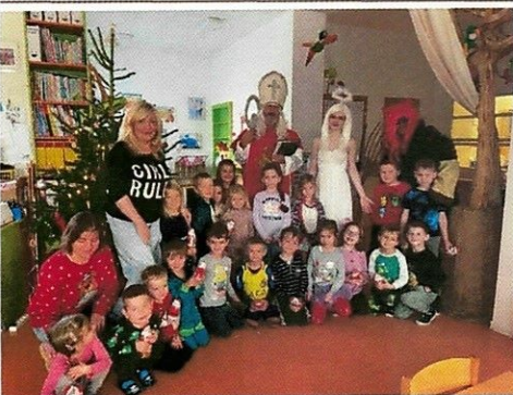
Děti z MŠ Ořešek slavily Mikuláše.